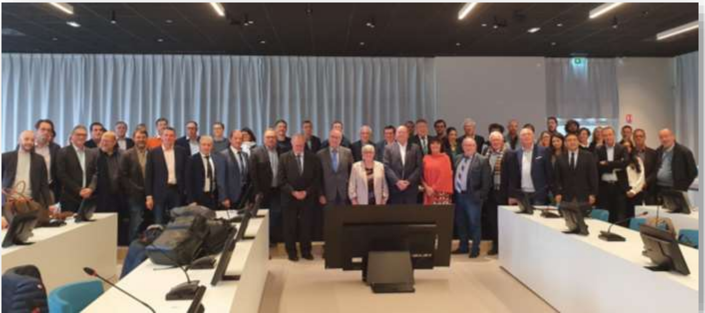
La Conférence des SCoT des Hauts-de-France du 17 octobre 2022. (photo des élus et techniciens présents)